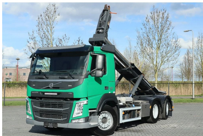
Volvo FM 460 6X2 6X2*4 EURO6 STEERING AXLE HYDRA...