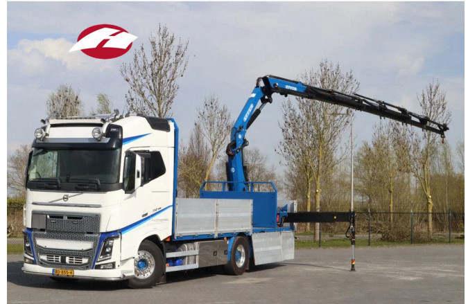
Volvo FH 16.750 | 6X2*4 RETARDER EFFER 215-6 DEMO...