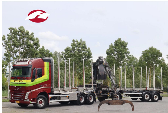
Volvo FH 500 | 6X4 | HIAB 140ST | ALUCAR | 3-AXLE TRAILER