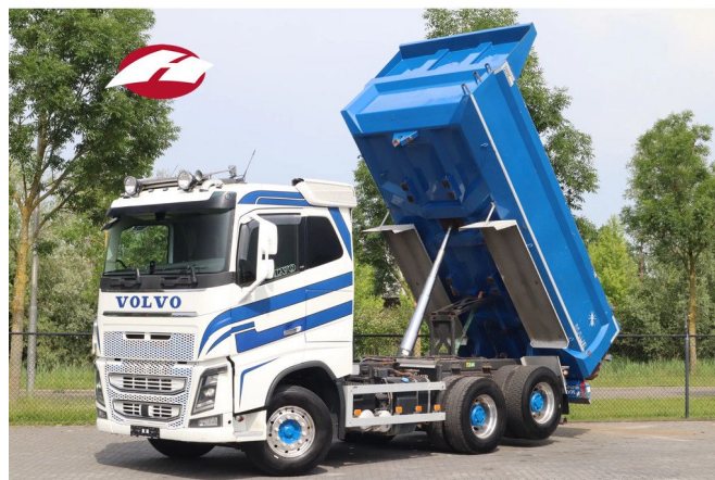
Volvo FH 16.750 | 6X4 | RETARDER | TANDEMLIFT | 80 TO...