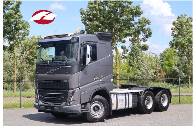
Volvo FH 16.750 | 6X4 | 100 TON | FULL STEEL | RETARD...