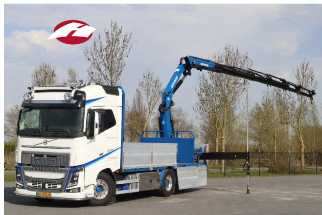
Volvo FH 16.750 | 6X2*4 RETARDER EFFER 215-6 DEMO...