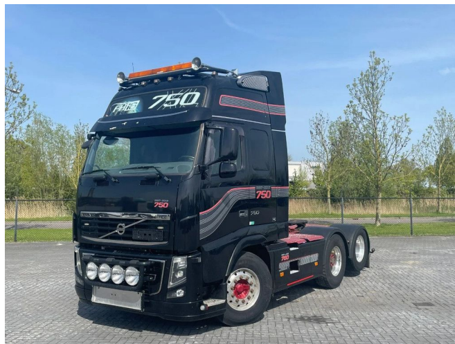
Volvo FH 16.750 6X2 HUB REDUCTION RETARDER SPECIAL