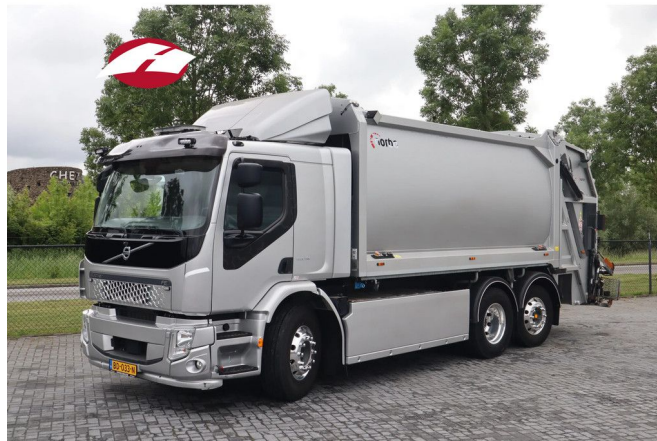
Volvo FE ELECTRIC | 6X2*4 | FULL ELECTRIC | NORBA | 2...