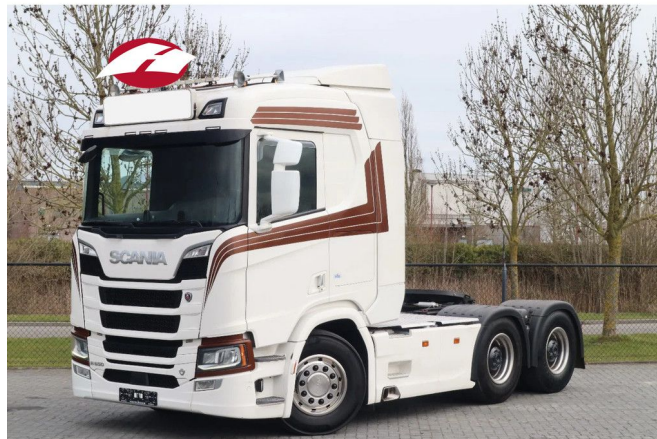
Scania R650 V8 NGS | 6X4 | RETARDER | BIG AXLES | HY...