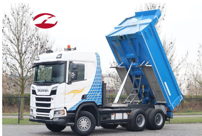
Scania R580 V8 NGS 6X4 | FULL STEEL | RETARDER | E...