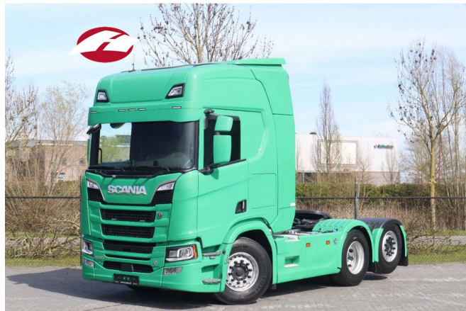
Scania R580 V8 NGS 6X2 | RETARDER | HYDRAULICS | E...