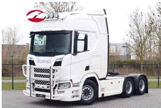
Scania R540 NGS 6X4 | RETARDER | BIG AXLES | EURO 6