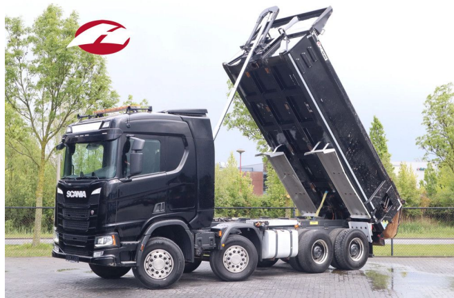
Scania R500 NGS | 8X4 | RETARDER | BIG AXLES | EURO 6