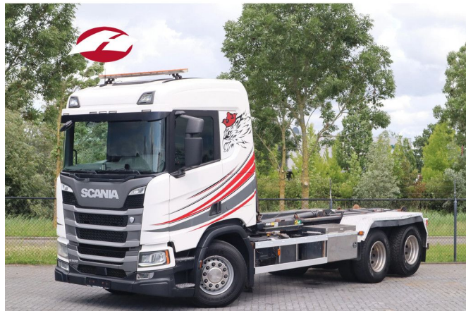
Scania R500 NGS 6X2 | RETARDER | JOAB HOOK | EURO 6