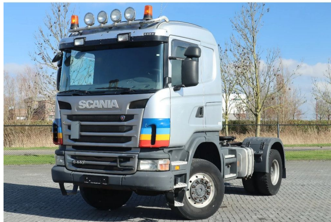
Scania G440 4X4 EURO 5 RETARDER HYDRAULIC