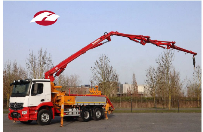
Mercedes-Benz Arocs 2546 6X2*4 | JUNJIN 25 METER | RE...