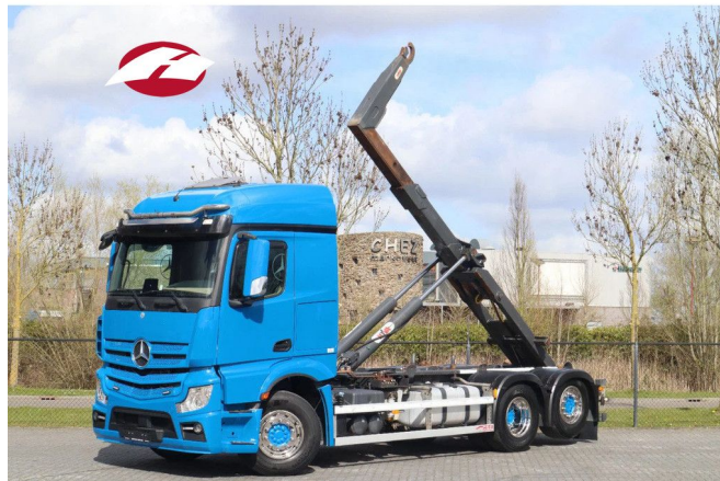
Mercedes-Benz Actros 2653 6X2 | RETARDER | HYVA HOO... Referentnummer: 113912-1