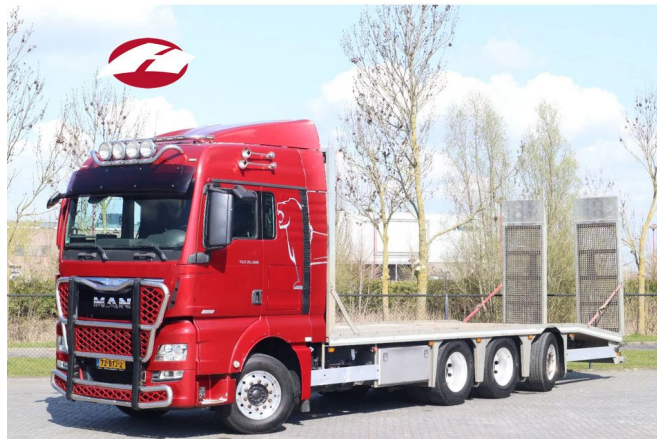
MAN TGX 33.560 | RETARDER | MACHINE TRANSP... 8x4 Referentnummer: 113907