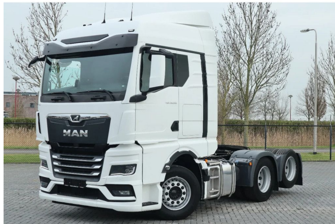
MAN TGX 28.510 6X2 RETARDER 67.500 KM FULL OPTIONS