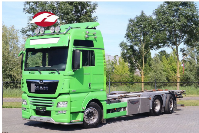
MAN TGX 26.640 | 6X2*4 | RETARDER | BDF | STEERING ...