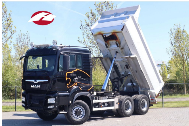
MAN TGS 26.500 | 6X6 | BIG AXLES | EURO 6