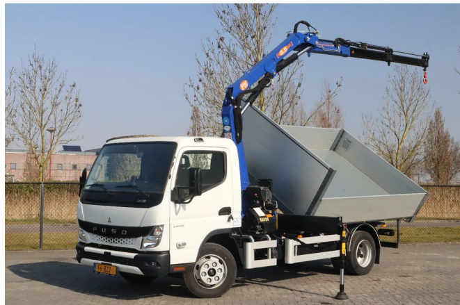
FUSO Canter 7C18 | 4X2 | 3-WAY TIPPER | PM 6.5 KRAN /...