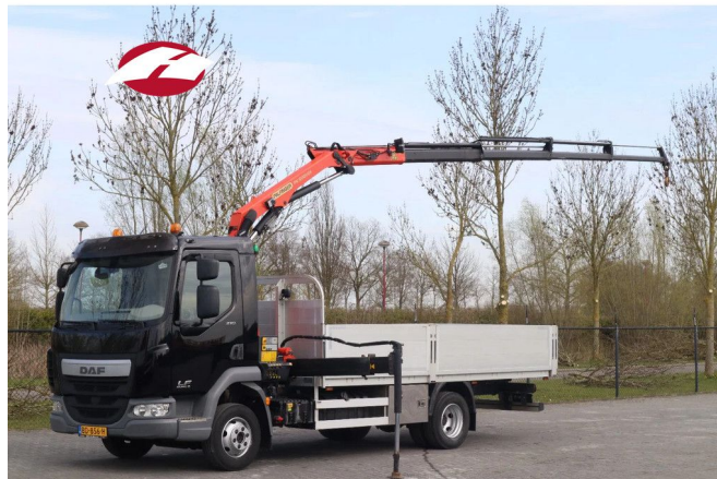
DAF LF 210 4X2 | 48.000 KM | PALFINGER PK5001 | REMOTE