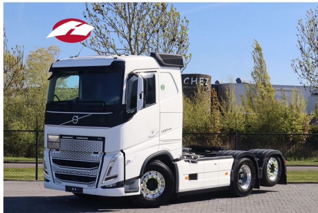
Volvo FH 500 | 6X2 | ADR | RETARDER | PTO / HYDR | EURO 6 Referentnummer: 114108