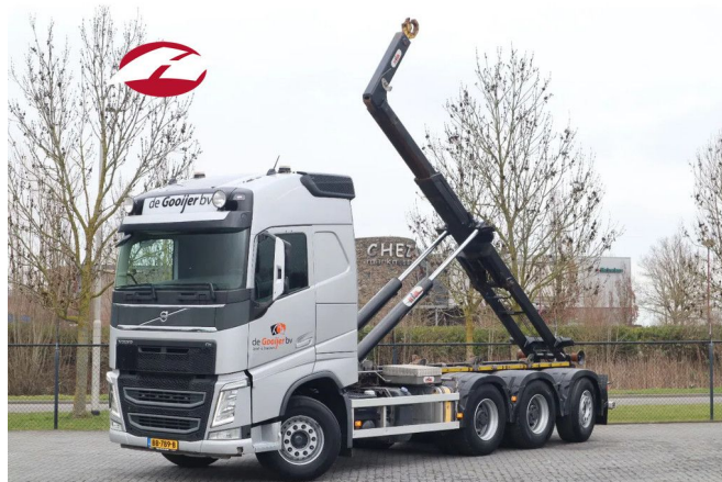
Volvo FH 460 8X4*4 | HYVA HOOKLIFT | BIG AXLES | EURO 6