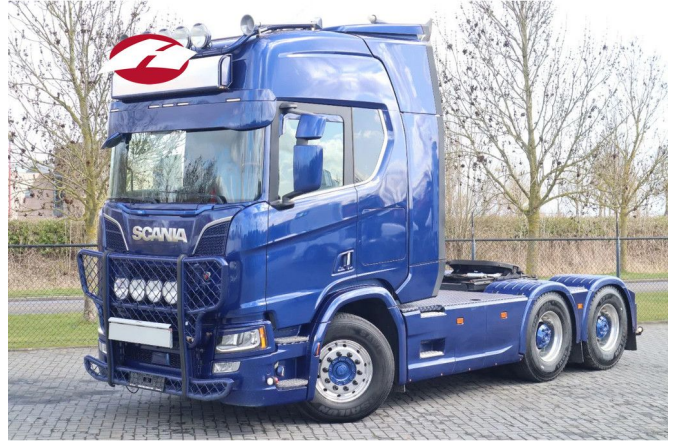
Scania R730 V8 NGS | 6X4 | 100 TON | RETARDER | BIG AX...