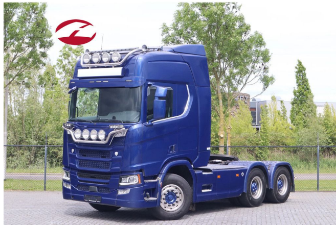
Scania R650 V8 NGS | 6X4 | BIG AXLES | RETARDER | HY...