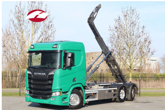
Scania R650 V8 NGS | 6X2*4 | JOAB HOOK | RETARDER | ...