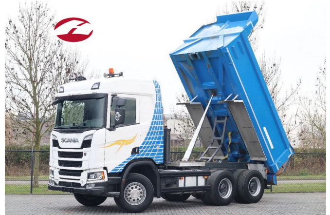
Scania R580 V8 NGS 6X4 | FULL STEEL | RETARDER | EU...