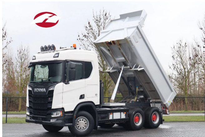
Scania R580 V8 NGS | 6X4 | FULL STEEL | RETARDER | E...