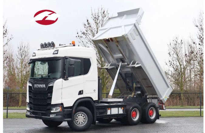
Scania R580 V8 NGS | 6X4 | FULL STEEL | RETARDER | E...