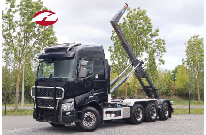
Renault C520 | 8X4 | AJK HOOK | RETARDER | BIG AXLES | ...