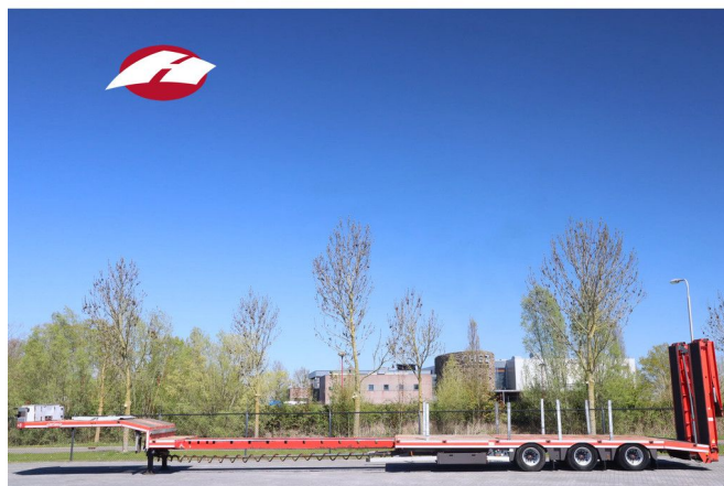
Nootboom OSDS-48-03-V | 6-MTR EXTENSION | WINCH | ...