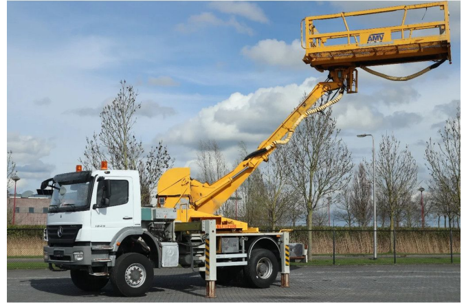
Mercedes-Benz Axor 1829 4X4 EURO 5 MANUAL FULL ST...