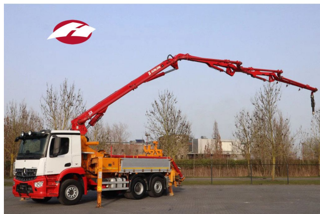
Mercedes-Benz Arocs 2546 6X2*4 | JUNJIN 25 METER | RE...