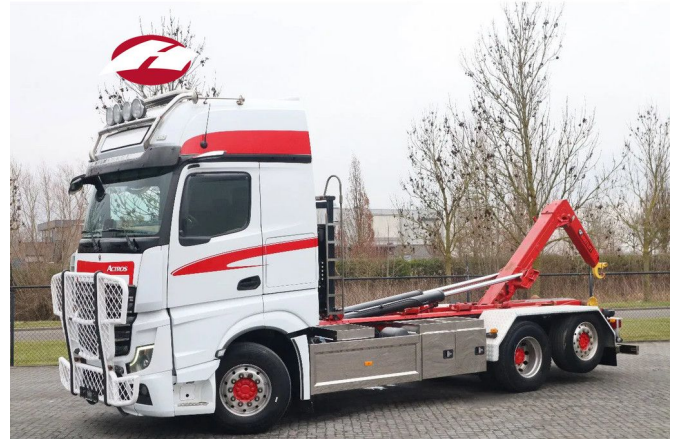
Mercedes-Benz Actros 2563 | 6X2 | MULTILIFT HOOK | RET...