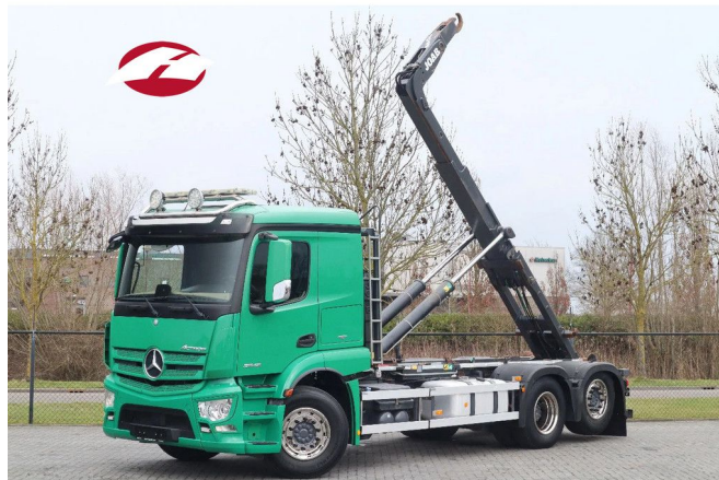
Mercedes-Benz Actros 2546 | 6X2 | JOAB HOOK | RETARD...