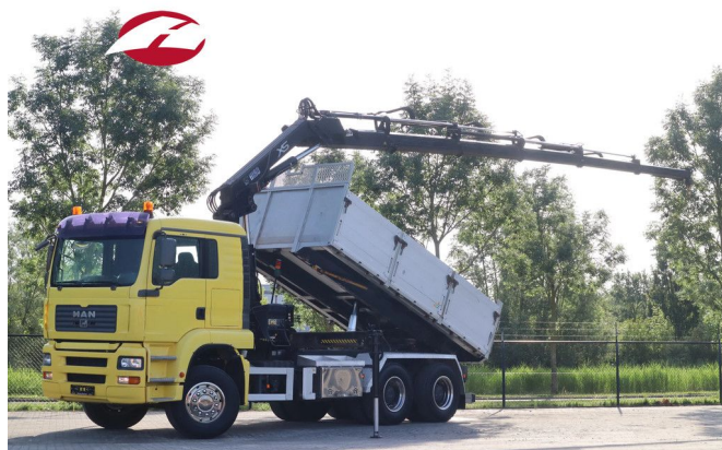
MAN TGA 33.480 | 6X4 | HIAB 166E-5 | KIPPER | HUB RED...