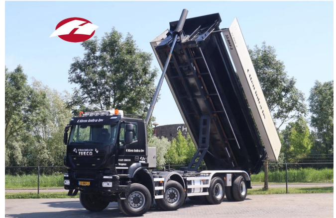
Iveco Trakker 410T45 | 8X8 | HYDR. ROOF | BIG AXLES | C...