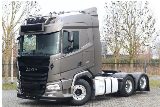
DAF XF 530 | 6X2 | RETARDER | FULL AIR | PTO PREP | E...