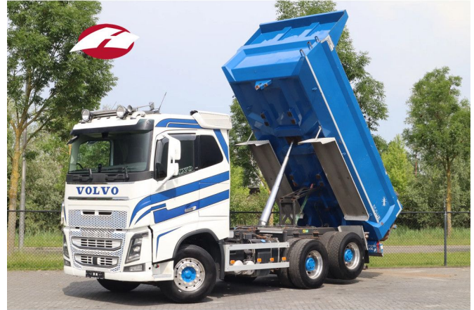
Volvo FH 16.750 | 6X4 | RETARDER | TANDEMLIFT | 80 TO...