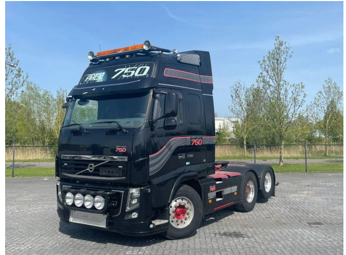
Volvo FH 16.750 6X2 HUB REDUCTION RETARDER SPECIAL