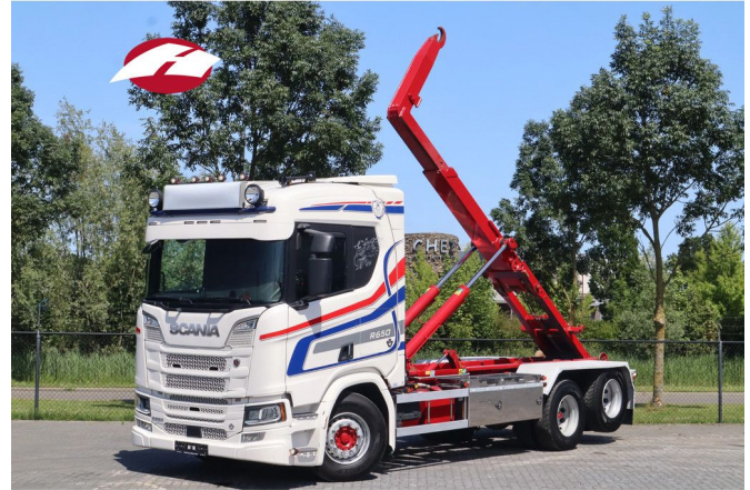
Scania R650 V8 NGS 6X2 | JOAB HOOK | RETARDER | EU...