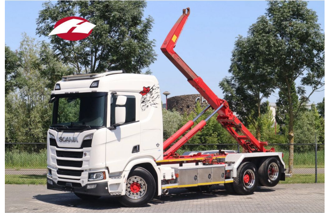
Scania R580 V8 NGS | 6X2 | AJK HOOKLIFT | RETARDER | ...