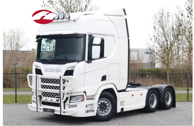
Scania R540 NGS 6X4 | RETARDER | BIG AXLES | EURO 6