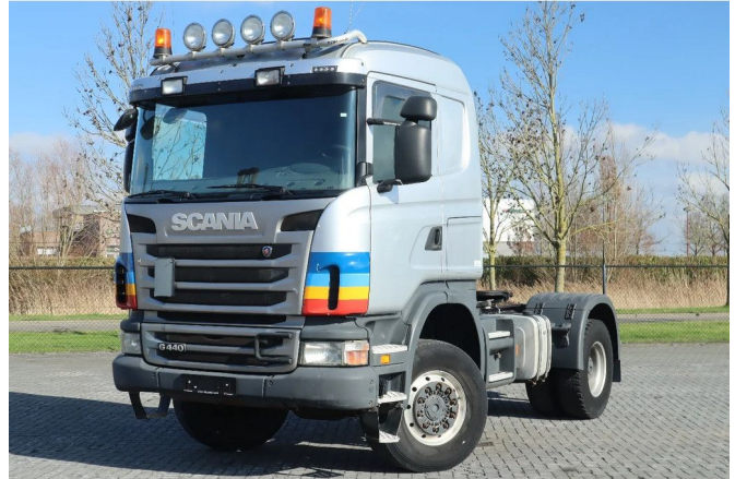
Scania G440 4X4 EURO 5 RETARDER HYDRAULIC