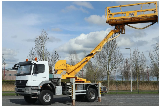
Mercedes-Benz Axor 1829 4X4 EURO 5 MANUAL FULL ST...