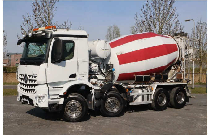
Mercedes-Benz Arocs 3251 | 8X4 | INTERMIX 10M3 | BIG AX...