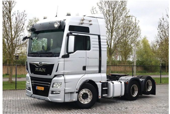
MAN TGX 28.580 | 6X2 | RETARDER | FULL OPTION | EURO 6