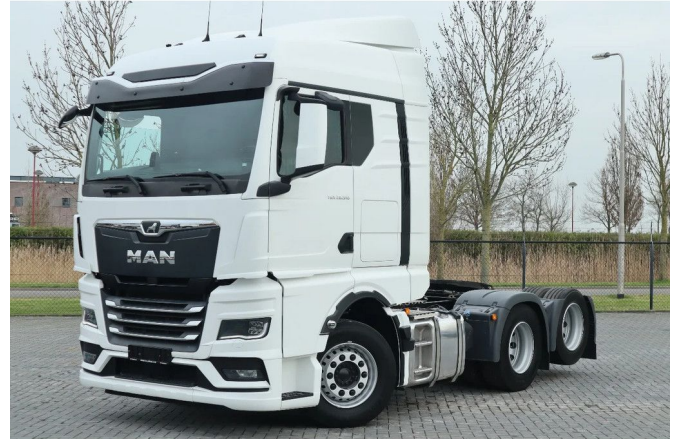
MAN TGX 28.510 6X2 RETARDER 67.500 KM FULL OPTIONS